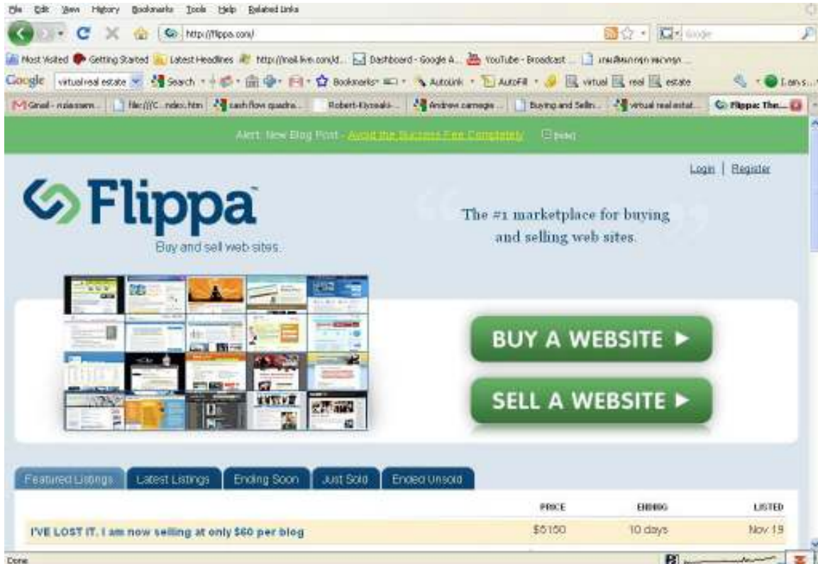
เว็บไซต์ Flippa.com

มีการซื้อขายเว็บไซต์กันเป็นมูลค่ากว่าหลายล้านบาททีเดียวครับ ใน 1 วัน ดูในหน้าต่อไป